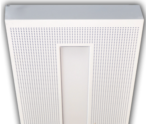
LED-Leuchte 481 in Metallkassette LED-lighting 481 in ceiling tile

Light distribution curve (information on request)